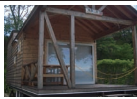
トレーラーハウス

〒509-9231 岐阜県中津川市上野589-17 TEL:0573-75-3250 FAX:0573-75-5215 HP http://www.hananoko-camp.jp/ <アクセス> 中央道中津川ICから約35分