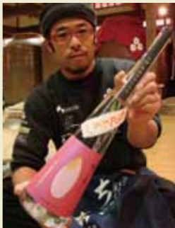
ちこり村 豊岡蔵長