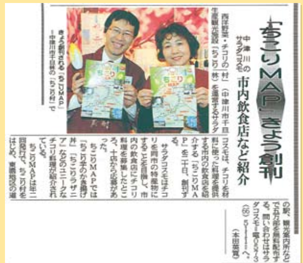
中日新聞 2009年(平成21年)3月20日掲載記事