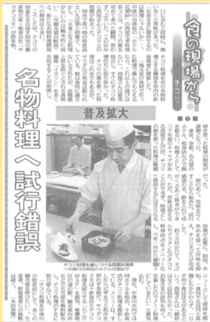
中日新聞 2009年(平成21年)4月21日掲載記事